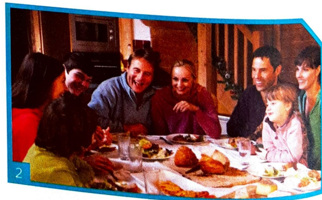
Zum Abendessen isst die Familie Brot / Brötchen und Wurst / Käse . Sie isst auch Gurken / Salat . Sie trinkt dazu Kaffee / Mineralwasser .