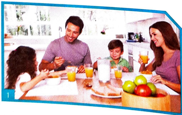
Die Familie isst zum Frühstück Cornflakes / Quark mit Milch / Joghurt . Sie isst auch Obst / Gemüse . Sie trinkt dazu Tee / Saft .