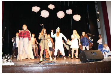
siedmaci = Hobiti