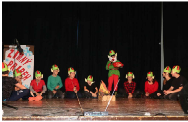
šiestaci = Škriatkovia