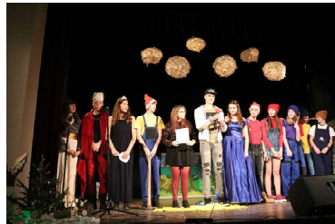
deviataci = Snehulienka