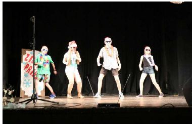
ôsmaci = Veselé tance